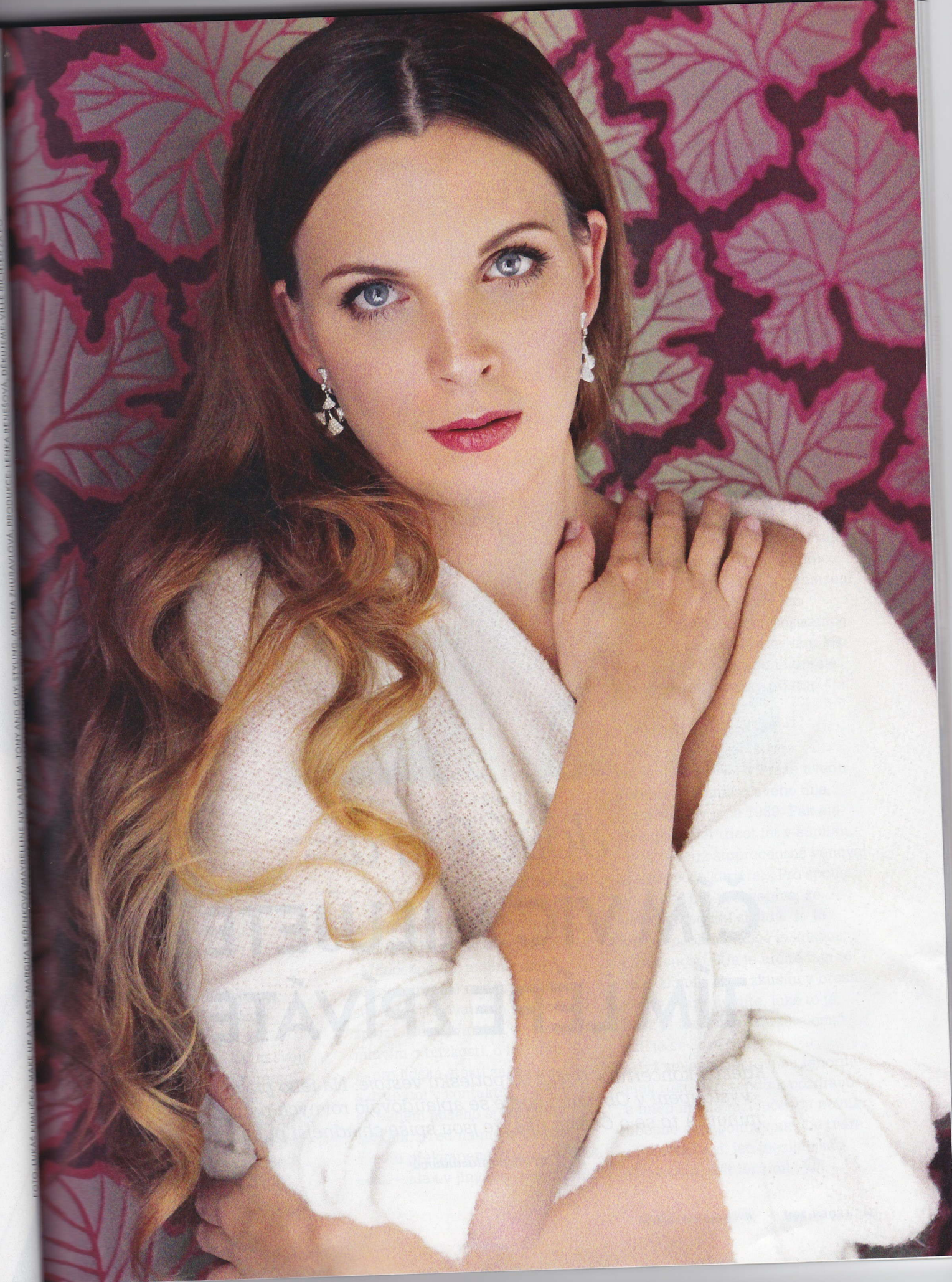
FOTO: LUKÁŠ POKUČKA, MAKE-UP: VLADYŠKA VEJNÍČKOVÁ, MAKE-UP: VLADYŠKA VEJNÍČKOVÁ, STYLING: MICHALA ZHODRÁVKOVÁ, PRODUCER: LEŇKA BEHEŠOVÁ, DEKORACE: VILKÉ RICHTER ZA POK